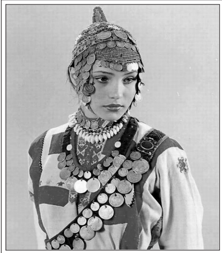
Чувашская девушка в национальном костюме.

ЧУВАШИ — народ в Среднем Поволжье. Субэтнические группы: вирьял (тури) «верховые», анатри «низовые», анат-енчи «средненизовые». Говорят на чувашском языке, относящемся к болгарской группе тюркской языковой семьи. В нём два диалекта: низовой («укаюший») в южных районах Чувашии и верховой («окаюший») в северных районах.